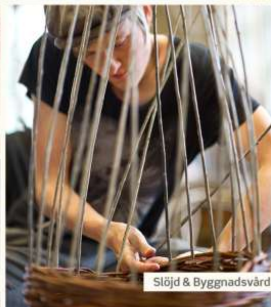
Slöjd & Byggnadsvård