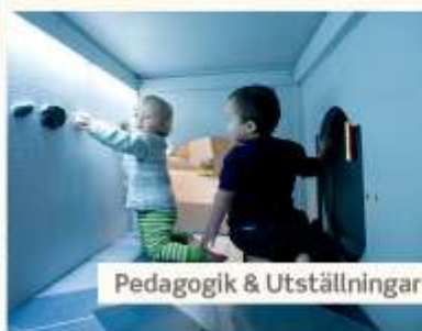
Pedagogik & Utställningar