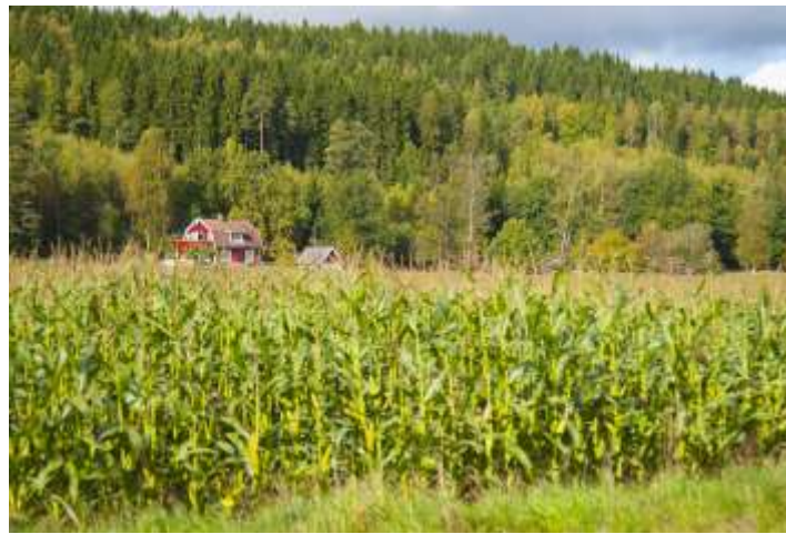
Essunga Odlingslandskap, 5500 invånare