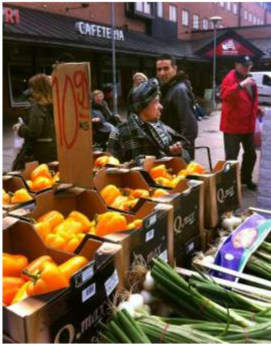
Nordöstra Göteborg 95 000 invånare