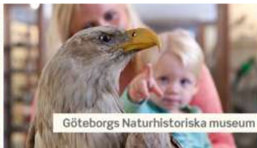
Göteborgs Naturhistoriska museum