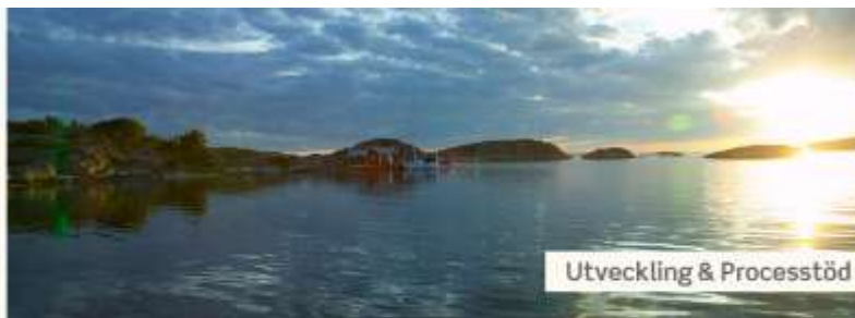
Utveckling & Processöd