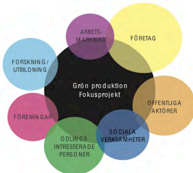
Figur 2: Indelning av övergripande aktörsanalys

Kartläggning skedde först genom en omfattande inventering av vilka offentliga, privata och ideella aktörer och projekt som verkar i och omkring Göteborg i frågan. Detta resulterade i att en aktörskarta togs fram. Denna bearbetades under den första workshoppen tillsammans med de inbjudna aktörerna. Övergripande bild av denna aktörskarta, se figur 2 nedan.