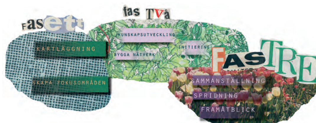
Figur 1: Arbetsprocess för Grön Produktion

Projektet har drivits under två år och har pågått under 2013 – 2014. För att skapa ordning i djungeln utarbetades en arbetsprocess indelad i tre faser, se figur 1 nedan.