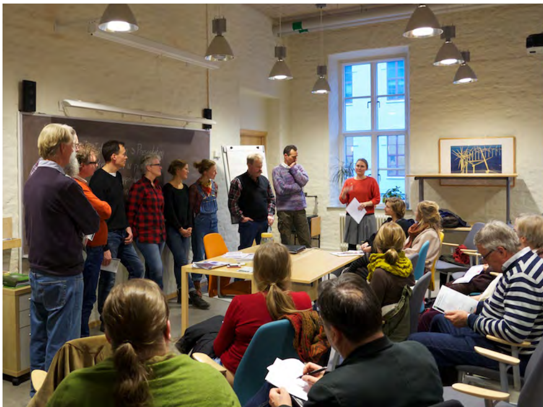
Andelsjordbruksträff på Ekocentrum - intresserade producenter presenterar sig

Ett antal aktiviteter kopplat till andelsjordbruk har genomförts i Göteborg med omnejd med privata konsumenter, krögare och lokala matproducenter. Syftet har varit att väcka intresset för modellen och att underlätta för direkta samarbeten mellan konsumenter och producenter samt att bidra till att nya nätverk bildas. En sammanställning av dessa aktiviteter finns i bilaga 1 till denna rapport och sammanfattningar av de flesta av dessa aktiviteter finns att ladda ner på Mistra Urban Futures hemsida.