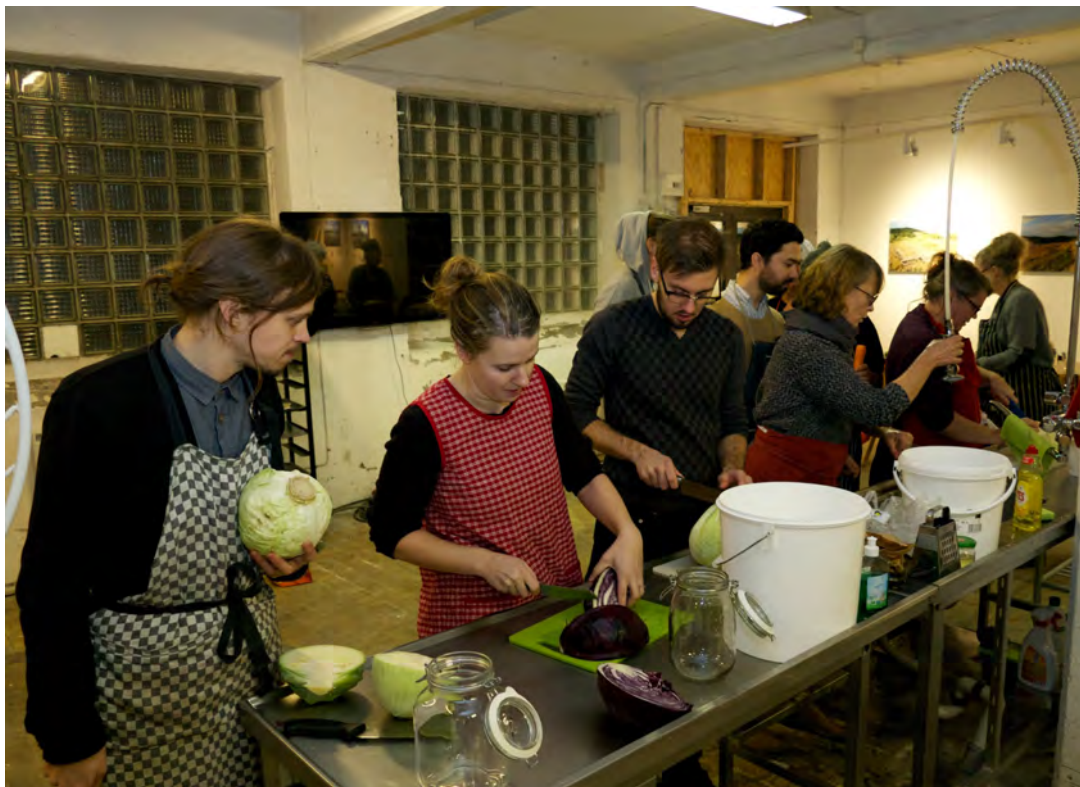
Mjölksyrningsworkshop i kursen Foodmaker GBG 2014

Framtiden för utbildningar inom området ser ljus ut. Då FoodMaker GBG blev en framgång kommer denna utbildning att ges även under 2015 i olika skepnader, troligtvis i Göteborg, Borlänge och Stockholm. ChangeMaker skriver under vårterminen 2015 en bok om FoodMaker som kurs och metod. ChangeMaker har fortsatt att fördjupa samarbete med Naturbruksgymnasierna (VGR) och Stadslandet (Göteborgs Stad) kring utbildnings- insatser i Göteborgsområdet. ChangeMaker är involverade i den process som pågår kring torget och Garveriet i Floda. Där står lokal mat, levande centrum och entreprenörskap i fokus.