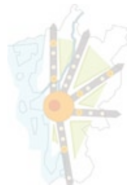
20 mars - Flernivåstyrning