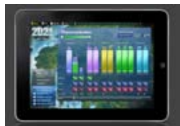
7 juni - Urbana spel

Bilder, uppifrån: Albin Holmgren, Strukturbild Göteborgsregionens kommunalförbund, Helena Davissson, Nindev AB och Sweco.