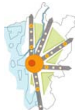
20 mars - Flernivåstyrning