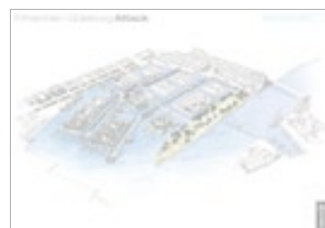
22 maj - Klimatanpassad stadsstruktur