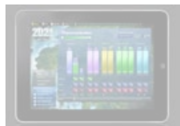
April - Urbana spel