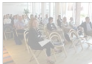
17 april - Affärsdriven hållbar stadsutveckling