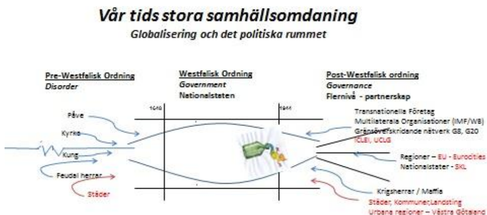
Bild 1: I slutet av den nationsbyggande epoken medförde ekonomisk utveckling och geopolitiska överenskommelser att "globaliseringsanden" successivt kunde ta sig ut ur den "nationella flaskan" och möjliggöra nätverkssamhällets globala framväxt. Därmed ökade