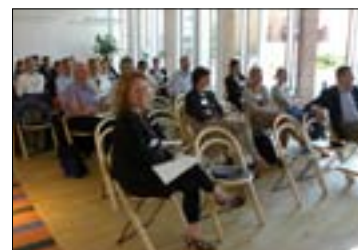
17 april - Affärsdriven hållbar stadsutveckling