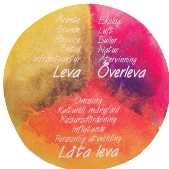
Illustration från ÖP 93 (antagen 1995).

"Göteborg ska utvecklas till en livskraftig långsiktigt hållbar stad med balans mellan sociala, ekonomiska och ekologiska/miljömässiga faktorer. Ett helhetstänkande är avgörande för möjligheten till hållbar utveckling för Göteborgssamhället. Det finns givna samband mellan mänsklig välfärd, ekonomisk utveckling och miljömässig hållbarhet."